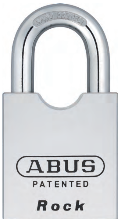
ARCO NO PROTEGIDO