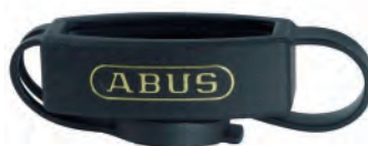
PROTECTOR DE CILINDRO