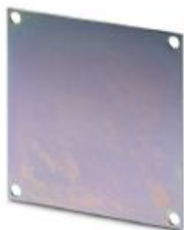
Placa de montaje, longitud: 2 mm, anchura: 250 mm, altura: 365 mm, color: plateado

Tenga en cuenta que los datos indicados aquí proceden del catálogo en línea. Los datos completos se encuentran en la documentación del usuario. Son válidas las condiciones generales de uso de las descargas por Internet. ( http://phoenixcontact.es/download )