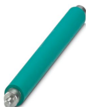
Rodillo de presión estándar

https://www.phoenixcontact.com/cl/productos/0804655