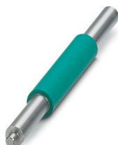
Rodillo de presión para entubado termorretráctil sin fin

https://www.phoenixcontact.com/cl/productos/0804656