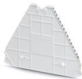
Tapa final, longitud: 100 mm, anchura: 2,2 mm, altura: 80,8 mm, color: blanco

Tenga en cuenta que los datos indicados aquí proceden del catálogo en línea. Los datos completos se encuentran en la documentación del usuario. Son válidas las condiciones generales de uso de las descargas por Internet. ( http://phoenixcontact.es/download )