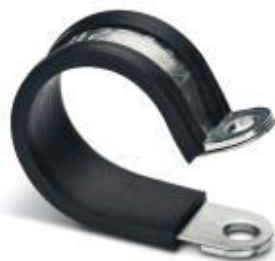
Pinza para manguera

Tenga en cuenta que los datos indicados aquí proceden del catálogo en línea. Los datos completos se encuentran en la documentación del usuario. Son válidas las condiciones generales de uso de las descargas por Internet. ( http://phoenixcontact.es/download )