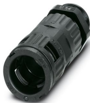
Prensaestopas, rosca Pg, grado de protección IP66, con retenedor de cable

Tenga en cuenta que los datos mostrados en este documento PDF se generaron a partir de nuestro catálogo online. Por favor, encontrará todos los datos en la documentación del usuario. Prevalecen nuestras condiciones generales de uso para descargas.