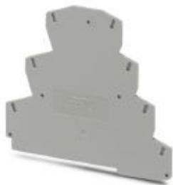
Tapa final, longitud: 99,5 mm, anchura: 2,2 mm, altura: 88 mm, color: gris

Tenga en cuenta que los datos indicados aquí proceden del catálogo en línea. Los datos completos se encuentran en la documentación del usuario. Son válidas las condiciones generales de uso de las descargas por Internet. ( http://phoenixcontact.es/download )