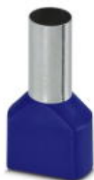
Puntera, longitud del manguito: 16 mm, longitud: 31 mm, color: azul

Tenga en cuenta que los datos indicados aquí proceden del catálogo en línea. Los datos completos se encuentran en la documentación del usuario. Son válidas las condiciones generales de uso de las descargas por Internet. ( http://phoenixcontact.es/download )