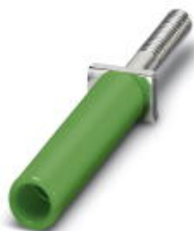
Hembra roscada, color: verde

Tenga en cuenta que los datos indicados aquí proceden del catálogo en línea. Los datos completos se encuentran en la documentación del usuario. Son válidas las condiciones generales de uso de las descargas por Internet. ( http://phoenixcontact.es/download )