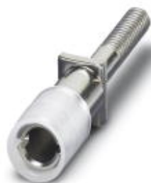
Hembra roscada, color: incoloro

Tenga en cuenta que los datos indicados aquí proceden del catálogo en línea. Los datos completos se encuentran en la documentación del usuario. Son válidas las condiciones generales de uso de las descargas por Internet. ( http://phoenixcontact.es/download )