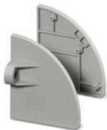
Brida, número de polos: 0, color: gris

Tenga en cuenta que los datos indicados aquí proceden del catálogo en línea. Los datos completos se encuentran en la documentación del usuario. Son válidas las condiciones generales de uso de las descargas por Internet. ( http://phoenixcontact.es/download )