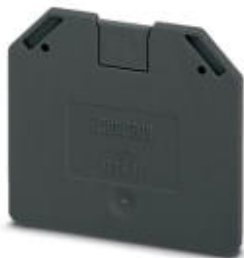
Tapa, longitud: 50 mm, anchura: 2,2 mm, altura: 42,8 mm, color: gris oscuro

Tenga en cuenta que los datos indicados aquí proceden del catálogo en línea. Los datos completos se encuentran en la documentación del usuario. Son válidas las condiciones generales de uso de las descargas por Internet. ( http://phoenixcontact.es/download )