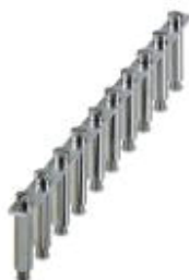
Puente fijo, paso: 13 mm, número de polos: 10, color: plateado

Tenga en cuenta que los datos indicados aquí proceden del catálogo en línea. Los datos completos se encuentran en la documentación del usuario. Son válidas las condiciones generales de uso de las descargas por Internet. ( http://phoenixcontact.es/download )