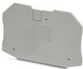
Tapa, anchura: 2,2 mm, color: Gris

Tenga en cuenta que los datos indicados aquí proceden del catálogo en línea. Los datos completos se encuentran en la documentación del usuario. Son válidas las condiciones generales de uso de las descargas por Internet. ( http://phoenixcontact.es/download )