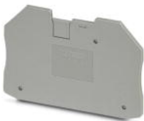
Tapa final, longitud: 65 mm, anchura: 2,2 mm, altura: 50,4 mm, color: gris

Tenga en cuenta que los datos indicados aquí proceden del catálogo en línea. Los datos completos se encuentran en la documentación del usuario. Son válidas las condiciones generales de uso de las descargas por Internet. ( http://phoenixcontact.es/download )