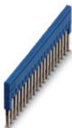
Puente enchufable, paso: 5,2 mm, número de polos: 20, color: azul

Tenga en cuenta que los datos indicados aquí proceden del catálogo en línea. Los datos completos se encuentran en la documentación del usuario. Son válidas las condiciones generales de uso de las descargas por Internet. ( http://phoenixcontact.es/download )