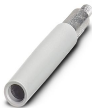
Regleta de clavijas de prueba, número de polos: 1, color: blanco

Tenga en cuenta que los datos mostrados en este documento PDF se generaron a partir de nuestro catálogo online. Por favor, encontrará todos los datos en la documentación del usuario. Prevalecen nuestras condiciones generales de uso para descargas.