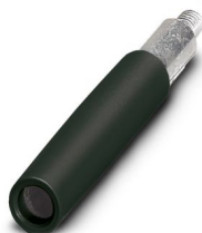
Regleta de clavijas de prueba, número de polos: 1, color: negro

Tenga en cuenta que los datos mostrados en este documento PDF se generaron a partir de nuestro catálogo online. Por favor, encontrará todos los datos en la documentación del usuario. Prevalecen nuestras condiciones generales de uso para descargas.