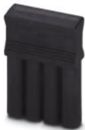
Conector de cortocircuito, paso: 8 mm, número de polos: 4, color: negro

Tenga en cuenta que los datos indicados aquí proceden del catálogo en línea. Los datos completos se encuentran en la documentación del usuario. Son válidas las condiciones generales de uso de las descargas por Internet. ( http://phoenixcontact.es/download )