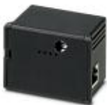
Módulo de comunicación Ethernet para EEM-MA600 con servidor web integrado

Módulo de comunicación - EEM-ETH-MA600 - 2901373