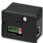
Módulo de comunicación pasarela de enlace RS-485/Ethernet para EEM-MA600 con servidor web integrado

Módulo de comunicación - EEM-ETH-RS485-MA600 - 2901374