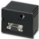
Módulo de comunicación PROFIBUS DP (12 Mbit/s) para EEM-MA600

Módulo de comunicación - EEM-PB 12-MA600 - 2901418