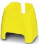
Marcado de color para cable Patch, amarillo

Marcado cromático - FL PATCH CCODE YE - 2891592