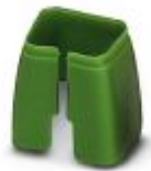
Marcado de color para cable Patch, verde

Marcado cromático - FL PATCH CCODE GN - 2891796