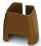
Marcado de color para cable Patch, marrón

Marcado cromático - FL PATCH CCODE BN - 2891495