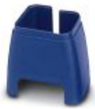
Marcado de color para cable Patch, azul

Marcado cromático - FL PATCH CCODE BU - 2891291