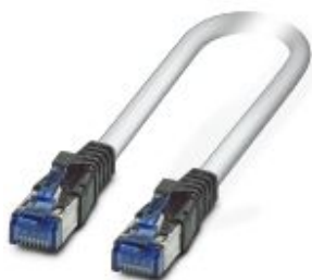
Cable Patch, CAT6, preconfeccionado, 1,0 m

Tenga en cuenta que los datos indicados aquí proceden del catálogo en línea. Los datos completos se encuentran en la documentación del usuario. Son válidas las condiciones generales de uso de las descargas por Internet. ( http://phoenixcontact.es/download )