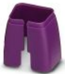
Marcado de color para cable Patch, violeta

Marcado cromático - FL PATCH CCODE VT - 2891990