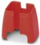
Elemento de seguridad para cable FL Patch

Elemento Port Guard Security - FL PATCH SAFE CLIP - 2891246