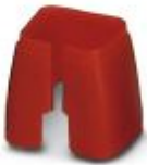
Marcado de color para cable Patch, rojo

Marcado cromático - FL PATCH CCODE RD - 2891893