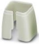
Marcado de color para cable Patch, gris

Marcado cromático - FL PATCH CCODE GY - 2891699