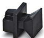
Capuchones roscados protectoras contra polvo, para hembra RJ45

Protecc. polvo - FL RJ45 PROTECT CAP - 2832991