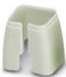
Marcado de color para cable Patch, gris

Marcado cromático - FL PATCH CCODE GY - 2891699