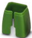
Marcado de color para cable Patch, verde

Marcado cromático - FL PATCH CCODE GN - 2891796