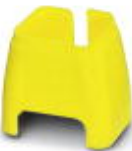
Marcado de color para cable Patch, amarillo

Marcado cromático - FL PATCH CCODE YE - 2891592