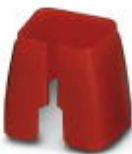
Marcado de color para cable Patch, rojo

Marcado cromático - FL PATCH CCODE RD - 2891893