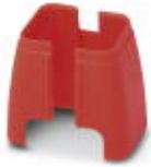
Elemento de seguridad para cable FL Patch

Elemento Port Guard Security - FL PATCH SAFE CLIP - 2891246