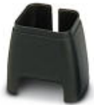
Marcado de color para cable Patch, negro

Marcado cromático - FL PATCH CCODE BK - 2891194