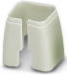
Marcado de color para cable Patch, gris

Marcado cromático - FL PATCH CCODE GY - 2891699