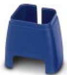
Marcado de color para cable Patch, azul

Marcado cromático - FL PATCH CCODE BU - 2891291