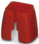
Marcado de color para cable Patch, rojo

Marcado cromático - FL PATCH CCODE RD - 2891893