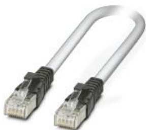
Cable Patch, CAT5, confeccionado, 1,5 m

Tenga en cuenta que los datos indicados aquí proceden del catálogo en línea. Los datos completos se encuentran en la documentación del usuario. Son válidas las condiciones generales de uso de las descargas por Internet. ( http://phoenixcontact.es/download )