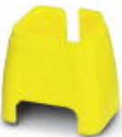
Marcado de color para cable Patch, amarillo

Marcado cromático - FL PATCH CCODE YE - 2891592