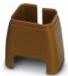
Marcado de color para cable Patch, marrón

Marcado cromático - FL PATCH CCODE BN - 2891495