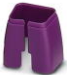
Marcado de color para cable Patch, violeta

Marcado cromático - FL PATCH CCODE VT - 2891990