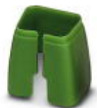
Marcado de color para cable Patch, verde

Marcado cromático - FL PATCH CCODE GN - 2891796