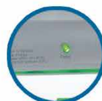
Indicador de carga