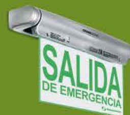
Montaje en pared