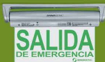
Montaje en techo