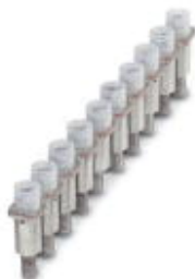
Puente fijo, paso: 8,2 mm, número de polos: 10, color: plateado

Tenga en cuenta que los datos indicados aquí proceden del catálogo en línea. Los datos completos se encuentran en la documentación del usuario. Son válidas las condiciones generales de uso de las descargas por Internet. ( http://phoenixcontact.es/download )