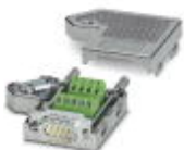
Conector D-SUB, 9 polos, macho, entrada de cables bajo 35°, modelo universal para todos los sistemas, ocupación de pins: 1, 2, 3, 4, 5, 6, 7, 8, 9 en bornes de conexión por tornillo

Conector de bus D-SUB - SUBCON 9/M-SH - 2761509