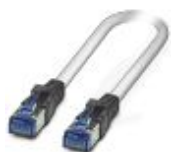
Cable Patch, CAT6, preconfeccionado, 12,5 m

Cable patch - FL CAT6 PATCH 12,5 - 2891369