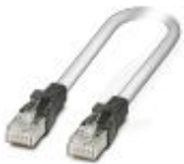
Cable Patch, CAT5, confeccionado, 5 m

Cable patch - FL CAT5 PATCH 5,0 - 2832580