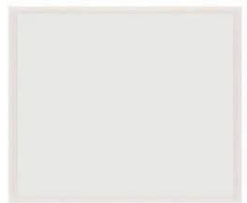
LUMINOUS INTENSITY DISTRIBUTION DIAGRAM