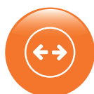
Diámetros disponibles 20, 25, 32, 40, 50, 63mm