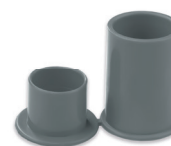
Salida de caja conduit