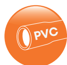
Material PVC (Policloruro de Vinilo)