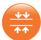
Resistencia a la compresión y al impacto 1.250N