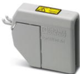
Cubierta, longitud: 120 mm, anchura: 43 mm, altura: 71 mm, color: gris

Tenga en cuenta que los datos indicados aquí proceden del catálogo en línea. Los datos completos se encuentran en la documentación del usuario. Son válidas las condiciones generales de uso de las descargas por Internet. ( http://phoenixcontact.es/download )