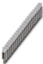
Puente fijo, paso: 6,2 mm, número de polos: 20, color: plateado

Tenga en cuenta que los datos indicados aquí proceden del catálogo en línea. Los datos completos se encuentran en la documentación del usuario. Son válidas las condiciones generales de uso de las descargas por Internet. ( http://phoenixcontact.es/download )