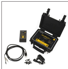
AT-100N Kit Apliweld-E. Kit completo encendido