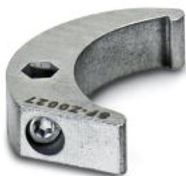
Llave de gancho

Tenga en cuenta que los datos indicados aquí proceden del catálogo en línea. Los datos completos se encuentran en la documentación del usuario. Son válidas las condiciones generales de uso de las descargas por Internet. ( http://phoenixcontact.es/download )