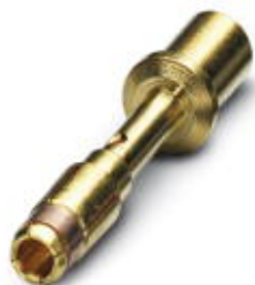
Contacto engastado, mecanizado, Contacto individual, diámetro de contacto: 2 mm, margen para engaste: 1 mm² ... 2,5 mm²

Tenga en cuenta que los datos indicados aquí proceden del catálogo en línea. Los datos completos se encuentran en la documentación del usuario. Son válidas las condiciones generales de uso de las descargas por Internet. ( http://phoenixcontact.es/download )