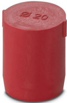
Tapón de cierre, color: rojo

Tenga en cuenta que los datos mostrados en este documento PDF se generaron a partir de nuestro catálogo online. Por favor, encontrará todos los datos en la documentación del usuario. Prevalecen nuestras condiciones generales de uso para descargas.