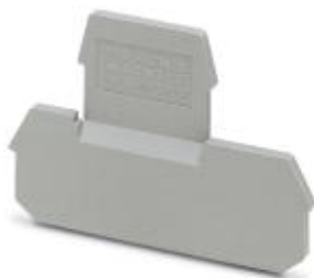
Tapa final, longitud: 62 mm, anchura: 5 mm, altura: 40 mm, color: gris

Tenga en cuenta que los datos indicados aquí proceden del catálogo en línea. Los datos completos se encuentran en la documentación del usuario. Son válidas las condiciones generales de uso de las descargas por Internet. ( http://phoenixcontact.es/download )