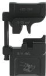
Matriz, para Crimpfox-M, para hembras de enchufe plano sin aislar

Tenga en cuenta que los datos indicados aquí proceden del catálogo en línea. Los datos completos se encuentran en la documentación del usuario. Son válidas las condiciones generales de uso de las descargas por Internet. ( http://phoenixcontact.es/download )