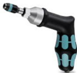
Destornillador dinamométrico, precisión según EN ISO 6789, ajustable de 3 - 6 Nm

Tenga en cuenta que los datos indicados aquí proceden del catálogo en línea. Los datos completos se encuentran en la documentación del usuario. Son válidas las condiciones generales de uso de las descargas por Internet. ( http://phoenixcontact.es/download )