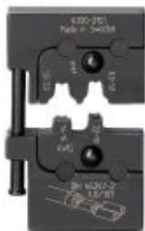
Matriz, para Crimpfox-M, para hembras de enchufe plano sin aislar 0,5 - 2,5 mm 2

Tenga en cuenta que los datos indicados aquí proceden del catálogo en línea. Los datos completos se encuentran en la documentación del usuario. Son válidas las condiciones generales de uso de las descargas por Internet. ( http://phoenixcontact.es/download )