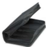
Estuche de herramientas, sin equipar

Maletín de herramientas, sin equipar - TOOL-KIT STANDARD EMPTY - 1212423