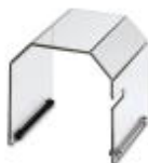
Tapa de repuesto, para la máquina automática para engastar CF 3000-2,5

Parte de la carcasa - CF 3000 GEHAEUSE HINTEN - 3202669