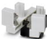
Cuchilla de repuesto para la máquina automática para desaislar y engastar CF 3000-2,5

Cuchilla de repuesto - CF 3000 AM 0,5 - 1205587