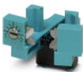
Pelacables de repuesto, para CF 3000-TOOLKIT 0,25

Cuchilla de repuesto - CF 3000 AB 0,25 - 1212380