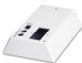
Parte de la carcasa, detrás del engarzador autom.

Parte de la carcasa - CF 3000 GEHAEUSE HINTEN - 3202669