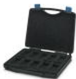
Maletín sin equipar