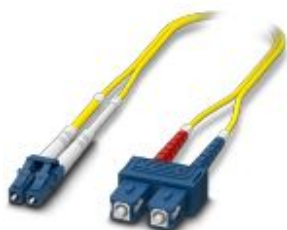
Cable de conexión dúplex OS2, monomodo, LC-SC, tipo UPC, longitud 2 m

Tenga en cuenta que los datos indicados aquí proceden del catálogo en línea. Los datos completos se encuentran en la documentación del usuario. Son válidas las condiciones generales de uso de las descargas por Internet. ( http://phoenixcontact.es/download )