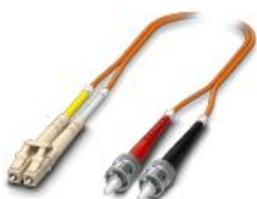
Cable de conexión dúplex OM2, multimodo, LC-ST, tipo UPC, longitud 3 m

Tenga en cuenta que los datos indicados aquí proceden del catálogo en línea. Los datos completos se encuentran en la documentación del usuario. Son válidas las condiciones generales de uso de las descargas por Internet. ( http://phoenixcontact.es/download )