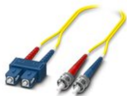
Cable de conexión dúplex OS2, monomodo, ST-SC, tipo UPC, longitud 1 m

Tenga en cuenta que los datos indicados aquí proceden del catálogo en línea. Los datos completos se encuentran en la documentación del usuario. Son válidas las condiciones generales de uso de las descargas por Internet. ( http://phoenixcontact.es/download )