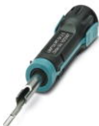
Herramienta para desbloquear, para contactos CK- 2,5-... girados

Tenga en cuenta que los datos indicados aquí proceden del catálogo en línea. Los datos completos se encuentran en la documentación del usuario. Son válidas las condiciones generales de uso de las descargas por Internet. ( http://phoenixcontact.es/download )