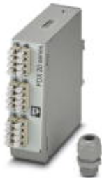
Caja de distribución para carril, montada completamente lista para empalmar, para 12x LC-Duplex (OM4)

Tenga en cuenta que los datos indicados aquí proceden del catálogo en línea. Los datos completos se encuentran en la documentación del usuario. Son válidas las condiciones generales de uso de las descargas por Internet. ( http://phoenixcontact.es/download )