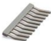
Peine puenteador, paso: 5,2 mm, número de polos: 10, color: gris