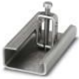
Soporte final, anchura: 8 mm