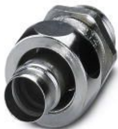
Prensaestopas de latón con rosca Pg, grado de protección IP40

Tenga en cuenta que los datos indicados aquí proceden del catálogo en línea. Los datos completos se encuentran en la documentación del usuario. Son válidas las condiciones generales de uso de las descargas por Internet. ( http://phoenixcontact.es/download )